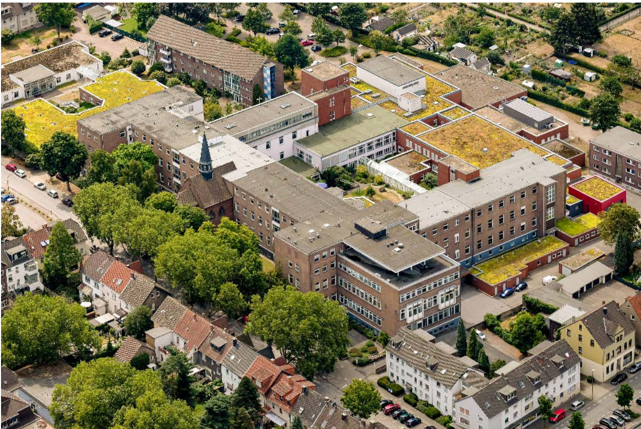
Elisabeth Krankenhaus Recklinghausen - zentral im Stadtteil Recklinghausen-Süd